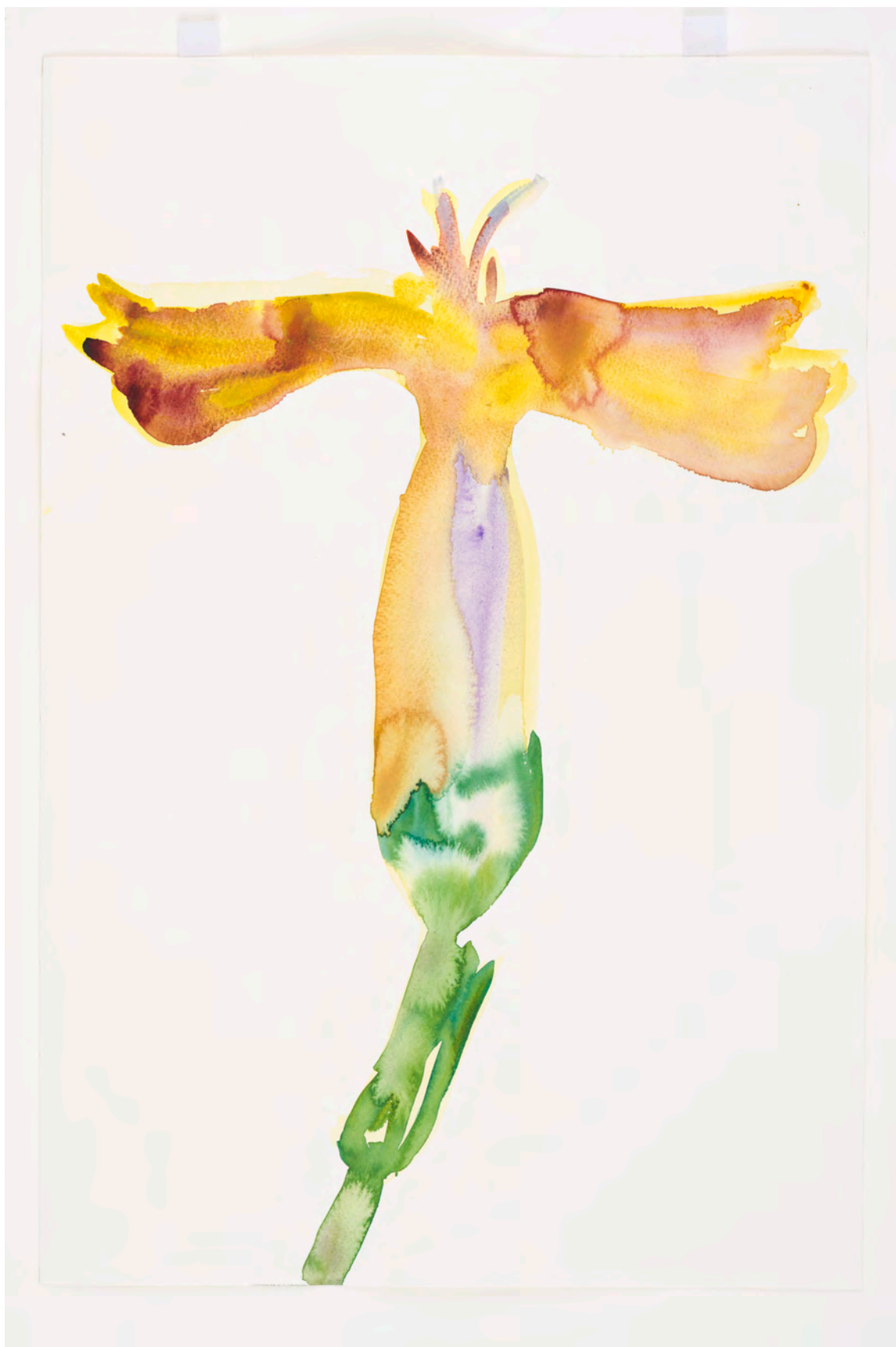
Lente (anjer geel + paars), 2020, watercolor, 45,5 x 30,5 cm